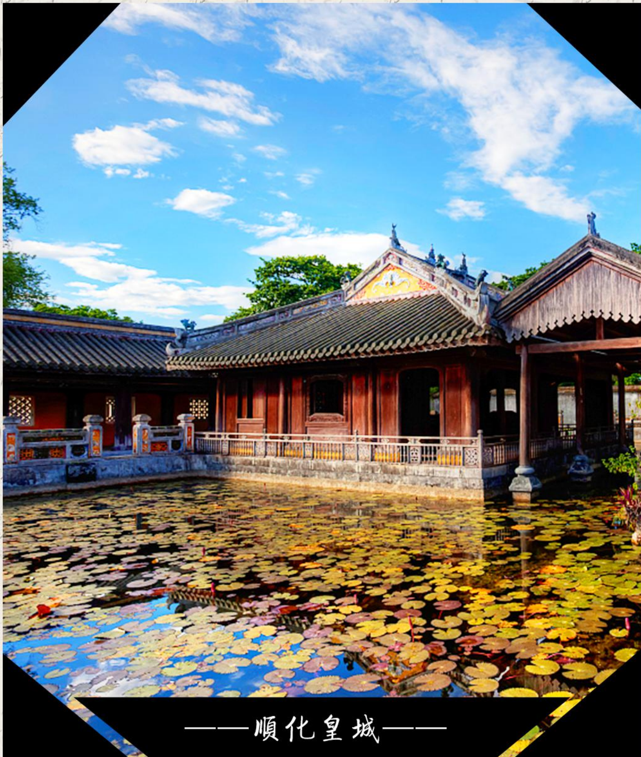
—— 順化皇城 ——

順化皇城，又名“大內”，是阮氏王朝皇宮，也是越南現存最大且較為整的古建築群。1687年奠定雛形，1805年開始修建，歷時數十年時間才建成現存規模。其建築的樣式，模仿北京的故宮，總面積6平方公里。皇城系方形，四周亦有護城河，城牆每邊長600多米，城門有四，即前午門、後和平門、左顯仁門、右彰德門。