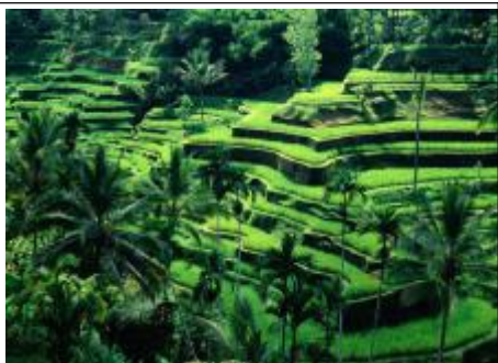
巴厘岛印象-乌布梯田