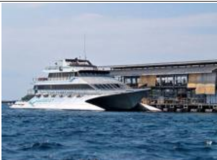
自费项目 1-全日爱之船出海游